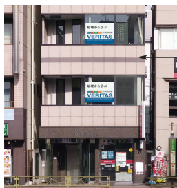
ヴェリタス1号館外観写真

1号館 - 学習進路相談室・教室・自習室 2号館 - 【受付】・講師室・教室・特別自習室