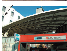
ヴェリタス2号館外観写真 (背景の白い建物がヴェリタスです)