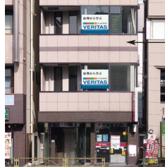
ヴェリタス1号館外観写真

1号館 - 学習進路相談室・教室・自習室 2号館 - 【受付】・講師室・教室・特別自習室