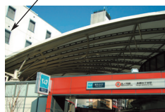
ヴェリタス2号館外観写真 (背景の白い建物がヴェリタスです)